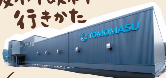
(株)友樹飲料 小城工場